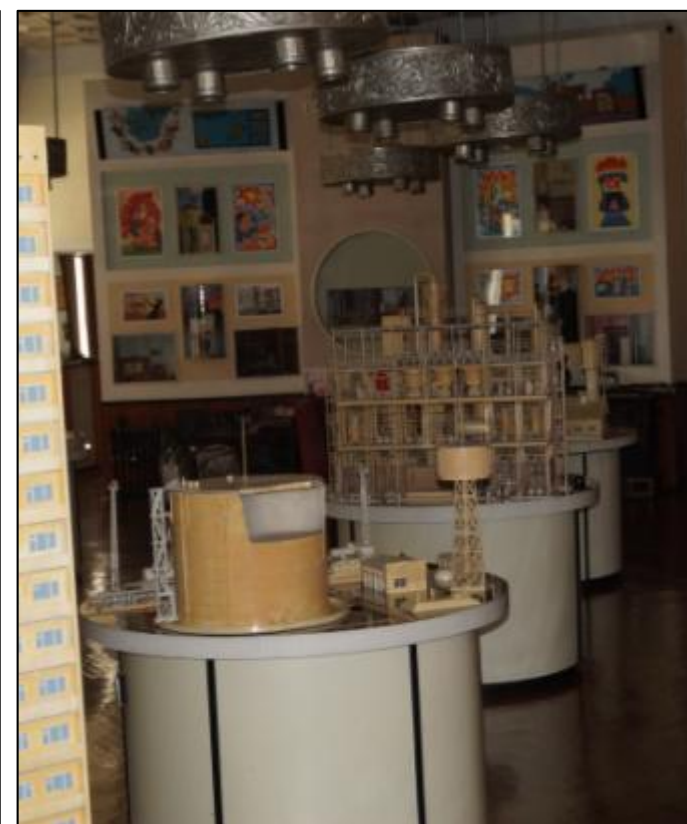
Одна из экспозиций музея

5 «Б» класс во время экскурсии в «Музей истории пожарной охраны» вместе с классным руководителем Бочаровой Валентиной Рафиковной.